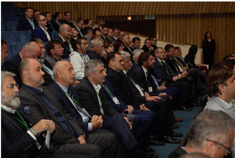
8. Kongres pilanara